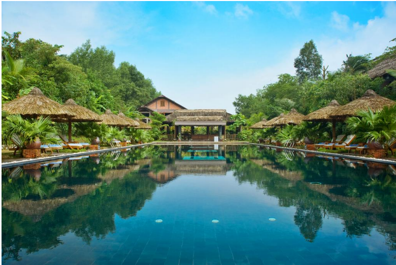
Hoi An: Hotel Le Pavillon Luxury resort & Spa 4* Habitación deluxe.