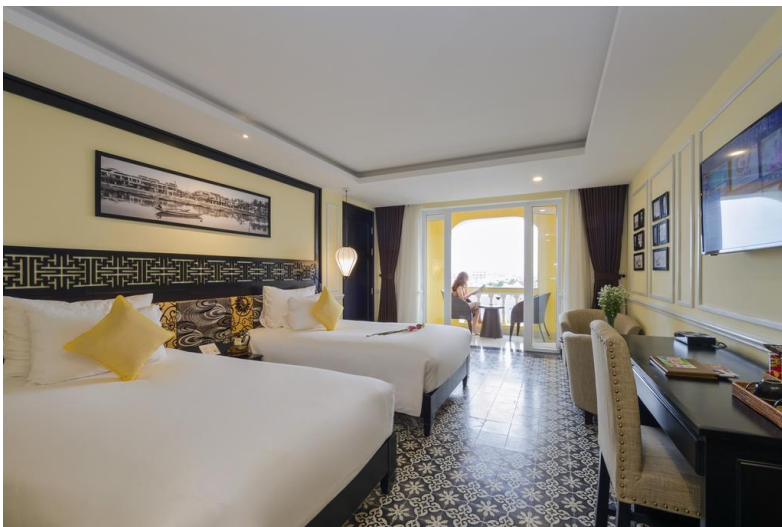
Ho Chi Minh ( Saigon ): Amena Residences and Suites managed by Meliá 4*. Habitación estandar.